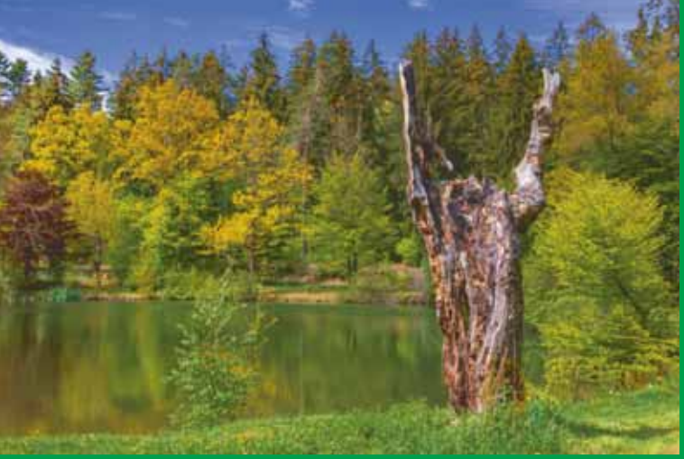
Der so genannte Pfingstweiher zwischen Kempfenbrunn und Mosborn