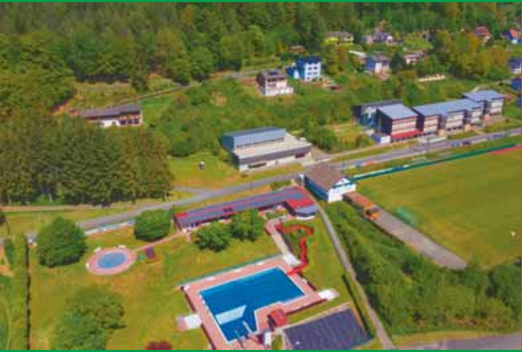
Blick auf Freibad mit Sportplatz und Schulgelände