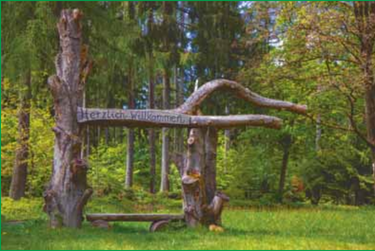
Willkommensgruß am Ortseingang von Mosborn

Kontakt und Infos: Vereinigung für Heimstätten der Sozialistischen Jugend, Bezirk Hessen/Süd e.V. Am Lohberg 11, 64367 Mühlthal, Tel.: 06151/9500701, Fax: 9500700 eMail: vfh@falken-hessen.de Homepage: www.vfh-falken-hessen.de