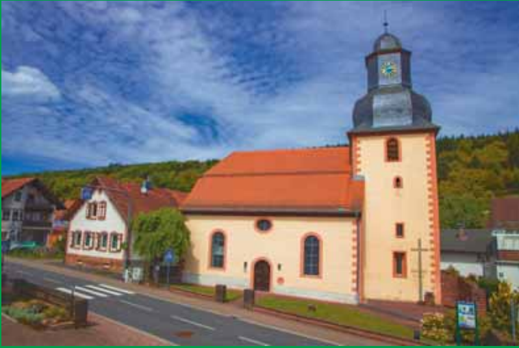
Die Kirche „St. Marien“ in Kempfenbrunn