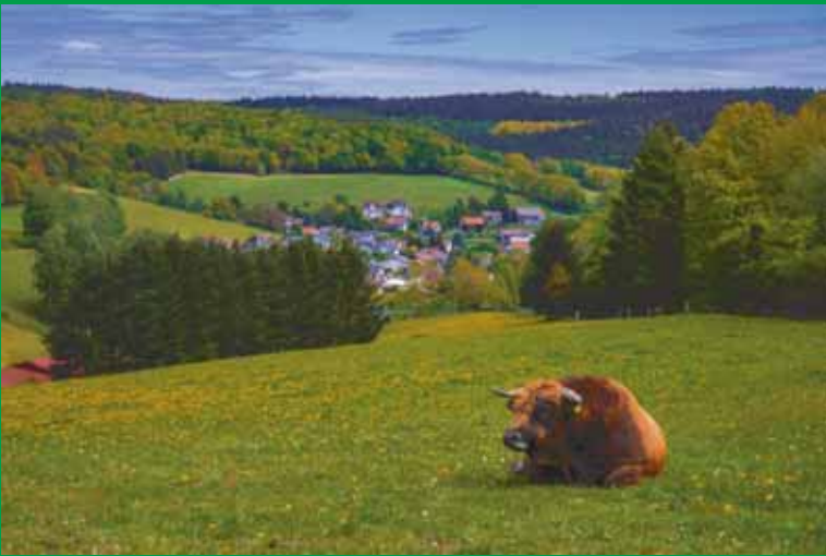
Idyllischer Blick auf Flörsbach vom Hartgrund aus