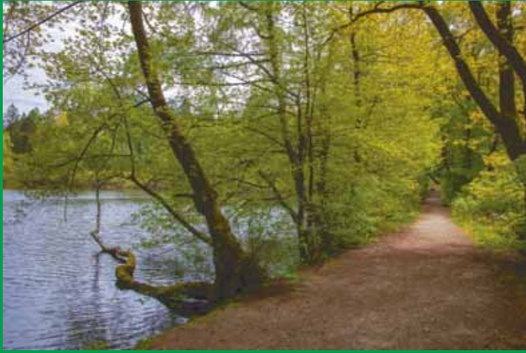
Blick auf den Wiesbüttsee mit dem Wanderweg, der die Grenze zu Bayern bildet