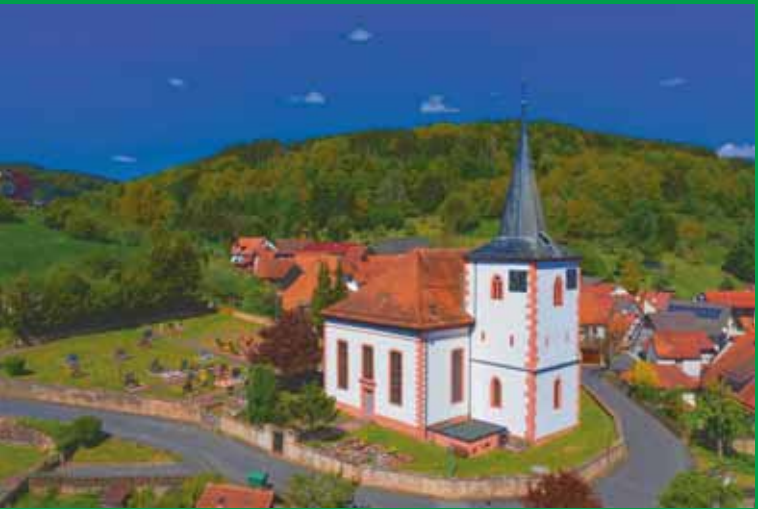
Die Matthäus-Kirche in Lohrhaupten