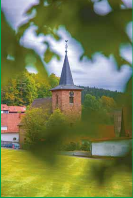
Der Turm der St.-Johannes-Kirche in Flörsbach