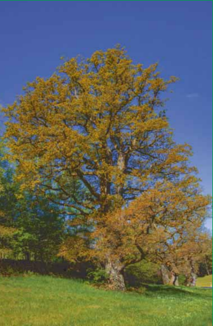
Die „Kreuzel-Eichen“, gelegen neben der Straße zur Bayrischen Schanz