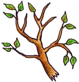
Äste und Zweige (Umfang kleiner als 15cm)