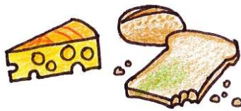
Milch- und Mehlprodukte